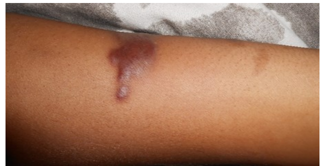
FIGURE 1C. Macules bien limitées, érythémateuse, apparaissant hyper-pigmentées par rapport à la peau sous-jacente.

Biologiquement on notait une anémie sévère microcytaire hypochrome (Hb = 7,0g/dl, VGM = 73,7 \mu m 3 , TCMH = 24,2pg), une thrombopénie sévère (49.000/ \mu m 3 ) sans signes de diathèse hémorragique, une lymphopénie à 186/mm 3 , une hypocalcémie à 1,55 mmol/l, une hyperphosphorémie à 1,51 mmol/l. Le GeneXpert réalisé dans l'expectoration n'a pas mis en évidence la présence du génome de Mycobacterium